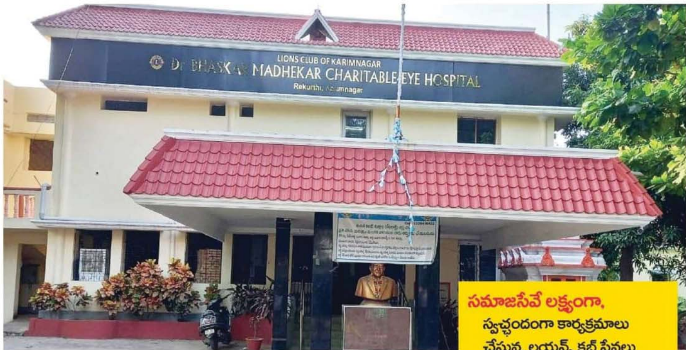
↑ రేకుర్తి ఆస్పత్రి