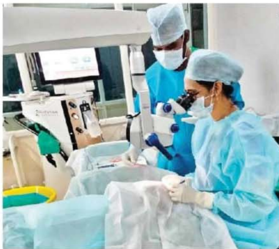
కంటి పరీక్షలు నిర్వహిస్తున్న వైద్యులు