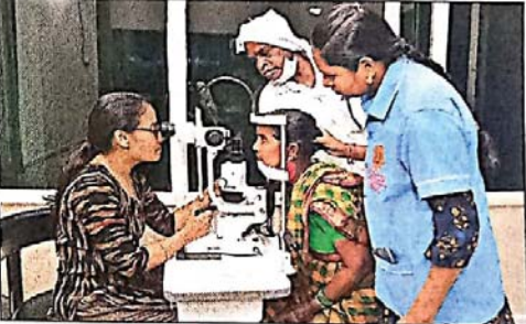
ఆస్పత్రిలో వైద్య పరీక్షలు

ఉత్తర తెలంగాణలో ప్రత్యేక గుర్తింపును అందుకున్న ఈ దవాఖానాలో ఇప్పటి వరకు 7,27,892 మందికి కంటి పరీక్షల్ని నిర్వహించారు. ముఖ్యంగా ఉమ్మడి కరీంనగర్ జిల్లాలోని మారుమూల గ్రామాల నుంచి నిత్యం బాధితులు తమ కంటి సమస్యలను పరిష్కరించుకునేందుకు ఇక్కడికి వస్తుంటారు. శుక్లాలోపాలు గ్లాకోమా ఇతర రకాల ఇబ్బందులను తొలగించేందుకు 89,324 మంది పేదలకు ఉచితంగా ఇక్కడ శస్త్రచికిత్సలను నిర్వహించారు. గ్రామాల్లో శిబిరాలను నిర్వహించడం మొదలు వారిని ఆస్పత్రికి తీసుకువచ్చి ఆహారాన్ని అందించి వైద్యచికిత్స అనంతరం సాంతూరికి ఆస్పత్రికి చెందిన బస్సుల్లోనే పంపిస్తున్నారు. ఇందుకోసం 58 మంది పారా మెడికల్ సిబ్బంది క్షేత్రస్థాయిలో పనిచేస్తుండగా.. కరీంనగర్