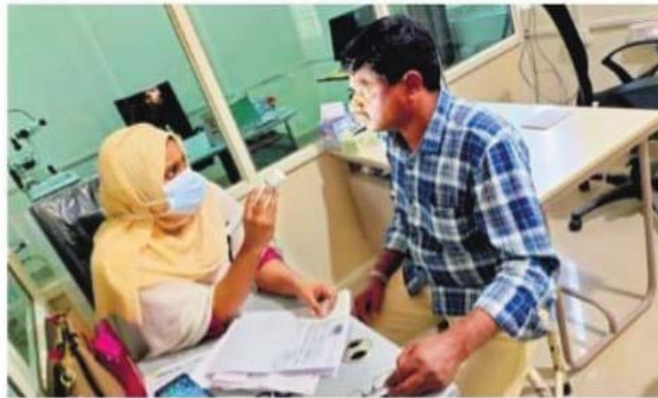
A staffer of the Dr Bhaskar Madhekar Charitable Eye Hospital checks a patient