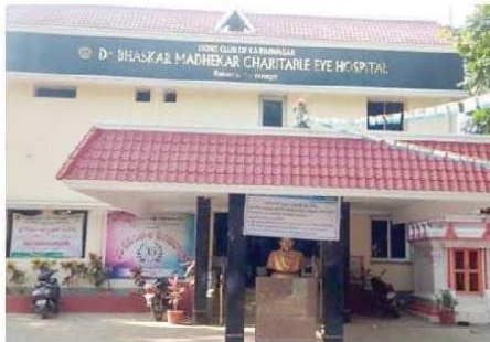
Rekurthi Eye Hospital

(THIRUNAGARI VENKATESHWARA SWAMY) KARIMNAGAR